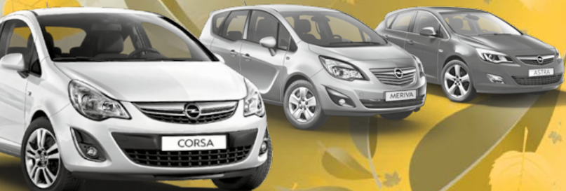
Abb. zeigen Sonderausstattung.